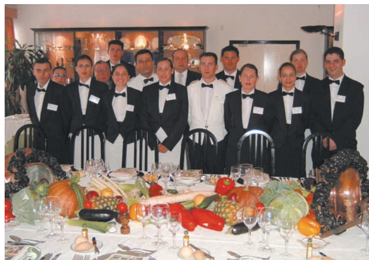
Lo más importante para la calidad es que los miembros de la organización se sientan felices y realizados.

La solución es darle a la calidad el valor que tiene. Que es mucho. Desde siempre ha sido la más importante y perdurable ventaja competitiva que ha existido. Pero la calidad es como la fe. Hay que creer en ella, hay que dedicarse a ella y hay que hacer de su práctica una "religión" perdurable. Sólo así conseguiremos iniciar el camino hacia la búsqueda de la mejora permanente, hacia la búsqueda de la excelencia. Los sistemas son uno de los medios para conseguir ese fin, aunque no el más importante. Hay aspectos emocionales, culturales y éticos sin los cuales la calidad se queda, con minúsculas, en "cumplir con las especificaciones". Aquella otra que se escribe con mayúsculas necesita de muchas otras cosas, la primera de las cuales es hacer de nuestra organización un lugar donde sus miembros se sientan felices y realizados. Si no es así, habría que replantearse todo partiendo de cero. ○